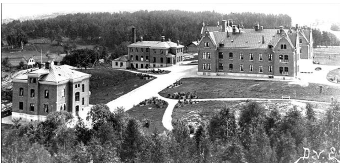
Länslasarettet i Linköping 1880-tal

Regionarkivet i Östergötland förvarar en stor del av länets samlade vårdhistoria från slutet av 1700-talet och framåt, en omistlig del av vårt läns historia och kulturarv. Vid landstingets tillkomst 1863 var ansvarsområdena bland annat arbetsförmedling, jordbruk- och fiskefrågor, skolor, barnhem, skjutsväsende och länspolis. Sjukvården blev landstingets huvuduppgift först under 1900-talet och har genererat de största arkiven. De äldsta arkiven är från Länslasarettan i Vadstena och Linköping, vilka startade 1791 respektive 1793.